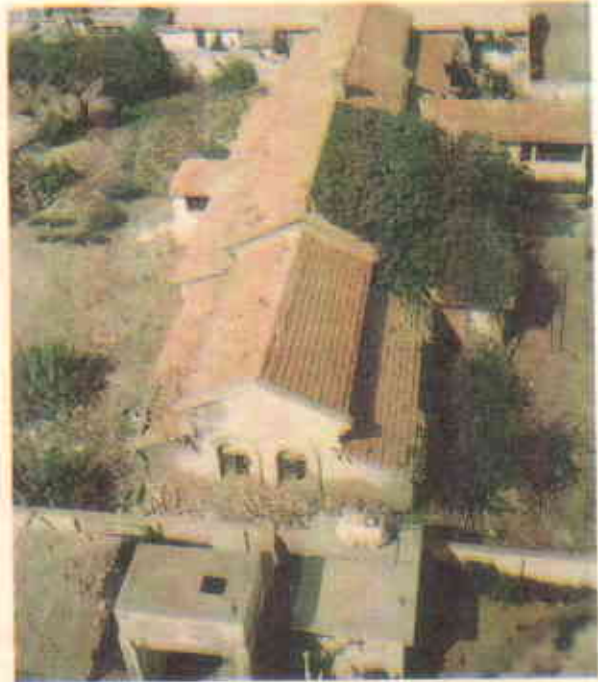
منوڑا میں کولونیل دور کی عمارتیں

ایسے منصوبے تجویز کئے جا رہے ہیں جن کے تحت منوڑہ میں رصدگاہ کو قدیم ریکارڈ اور تصاویر، سندھ کے پرنڈوں کی نمائش کے لئے استعمال کیا جاسکے گا۔ نیوی ہاؤس کو فمیلی ہوٹل بنائی صفحہ ۱۹ پر