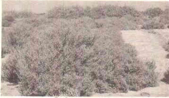
جانوروں کے چارے کے لئے سجاوٹ میں کاشت کی گئیں تخمیناً جھاڑیاں

* جواب۔ جیسا کہ میں نے پہلے عرض کیا کہ ہمیں ایسے لوگوں کی ضرورت ہے جو اس سلسلے میں تحقیق و ترقی کے منصوبوں پر سرمایہ کاری کر سکیں۔ اگر سرمایہ دستیاب بھی ہو تو یہ سرمایہ کاری طویل مدت کے لئے ہوگی۔ اس کے لئے افرادی قوت دستیاب ہے لیکن اس کی امداد اور حوصلہ افزائی کی ضرورت ہے۔