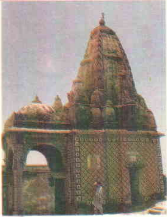
منوڑا کا ایک خوبصورت ہندو مندر